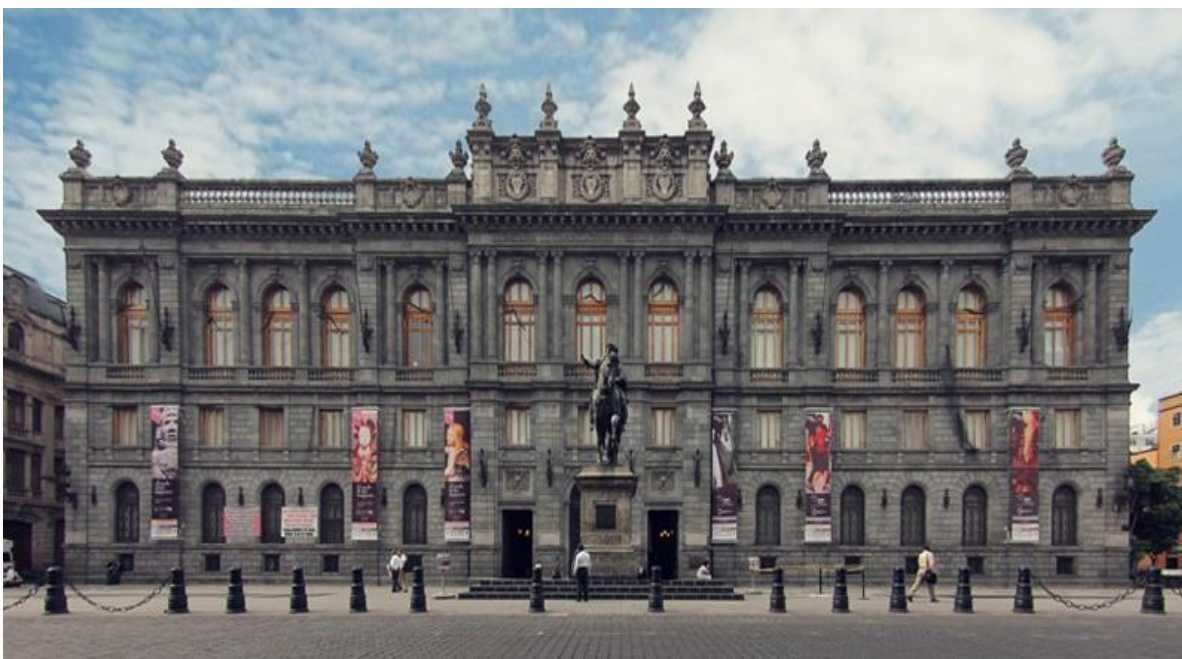
El Museo Nacional de Arte, ubicado en Tacuba No.8, tomada de https://www.google.com.mx/search?q=El+MUNAL&source=lnms&tbn=isch&sa=X&ved=0ahUKEwj6ke_6xejUAhVFQYKXHUTRB84Q_AUICigB&biw=1280&bih=670#imgrc=IUXFf9h_WhlhXM , consultado el 22 de junio, 2017.

Retomando el MUNAL, este corresponde al Instituto Nacional de Antropología e Historia su administración y resguardo del mismo, este como pieza arquitectónica se restauró en 1997, por lo tanto a la actualidad, considerando los pasajes históricos mencionados previamente, este resguarda una historia de más de 110 años. ( https://es.wikipedia.org/wiki/Museo_Nacional_de_Arte_Mexico , consultado el 20 de junio, 2017)